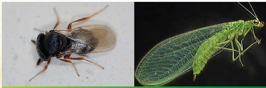
Slike 7 i 8. Prirodni neprijatelji crne štitaste uši masline - Scutellista cyanea (lijevo) i Chrysoperla carnea (desno).

Od potencijalnih prirodnih neprijatelja u našem području može se istaknuti vrsta Scutellista cyanea , čije se ličinke hrane jajima maslinova mediča. Vrsta Exochomus quadripustulatus rasprostranjen je grabežljivac jaja i ličinki štitastih uši, a Chilocorus bipustulatus i Chrysoperla carnea (Neuroptera, Chrysopidae) grabežljive su vrste također prisutne na području Hrvatske. Rhyzobius forestiri također se hrani jajima i ličinkama maslinina mediča, a potencijalno može biti učinkovit predator crne štitaste uši araukarije.