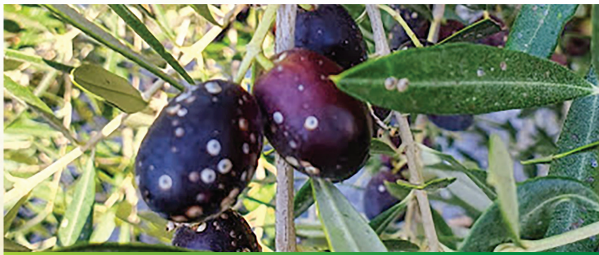
Slika 4. Simptomi napada na plodovima masline

Na maslini u okolici Sutivana zabilježeno je i do 120 jedinki štitastih uši po listu. Nažalost, crna štitasta uš kolonizira i plodove masline. Na plodovima zabilježeno je čak do stotinjak jedinki toga štetnika. Takvi plodovi prijevremeno sazrijevaju. Kakvoća ulja od jako napadnutih plodova itekako je smanjena. Osim toga, takvi su plodovi neupotrebljivi u proizvodnji stolnih maslina.