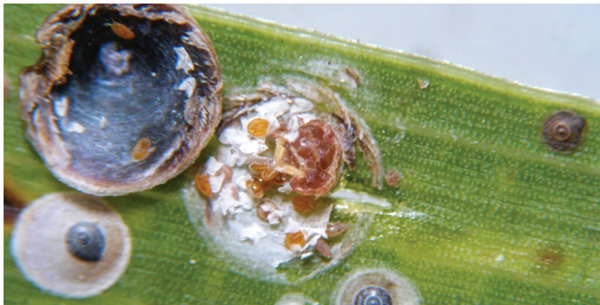
Slika 2. Ličinke prvog stadija i jaja ispod štita odrasle ženke na listu palme

Štitaste uši karakteristični su biljni štetnici čije je tijelo prekriveno „štitom“, tvrdom i čvrstom strukturom koja ih štiti. Hrane se sisanjem biljnoga soka. Štitovi crne štitaste uši araukarije ovalni su do okruglasti, spljošteni i promjera 2 - 2,5 mm. Mogu biti bijeli, sivi do svijetlosmeđi. Tijela odraslih ženki i mužjaka te ličinke i jaja nalaze se ispod štita. Pokretne su samo ličinke prvog stadija.