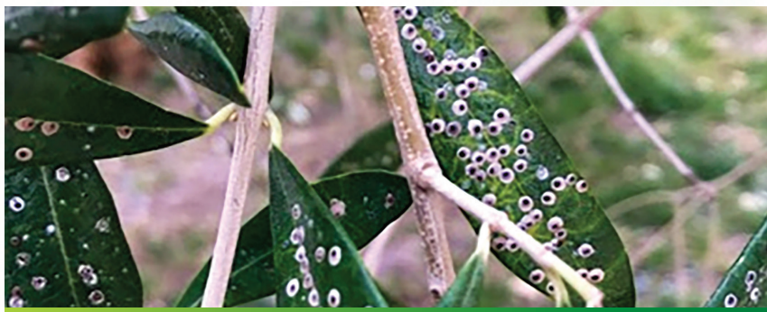
Slika 9. Jak napad na listovima masline