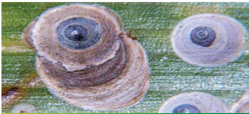
Slika 3. Štitovi odrasle ženke