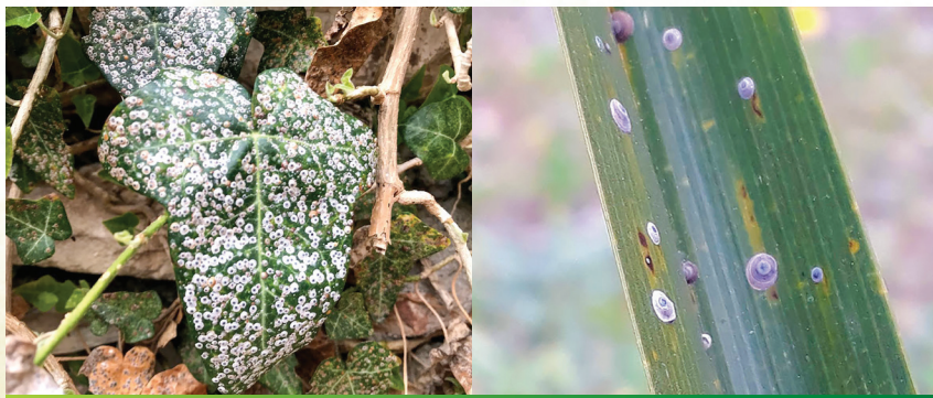
Slika 5. i 6. Jak napad na listovima bršljana / Crna štitasta uš na listu palme

U svijetu je crna štitasta uš zabilježena na biljkama iz čak 62 porodice. Među njima nalaze se brojne biljke prirodno raširene u mediteranskom području Hrvatske, koje se koriste kao ukrasno bilje ili se uzgajaju kao poljoprivredne kulture. Biljke domaćini najčešće su palme iz porodice Arecaceae , araukarija, bagrem, lovor, fikus, eukaliptus, kalina, bor, kamelija, agrumi, kaki, kruška i jabuka.