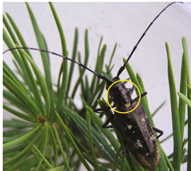
Kuuse-puidusiku kattetiibade ülaosas on kollakas kilbike, aasia sikkul must

Aasia siku mardikas muneb ühekaupa munad elusate puude koorde näritud koonusjatesse lohkudesse ehk munemislehtrisse. Munad (5–7 mm) on pikliku kujuga kreemjat värvi.