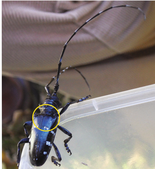
Aasia sikk

Sarnased mardikad on kuuse-puidusikk, männi-puidusikk, pugalsikk.