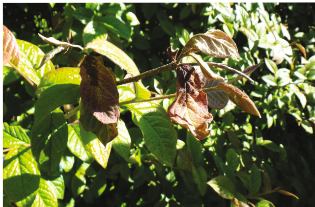
Haigestunud taimed →