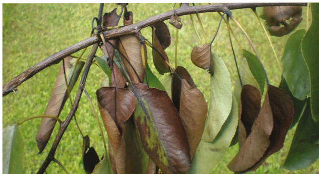
E. amylovora kahjustus pinnil

Noored istikud hävivad 1-2 aastaga, vanemad puud jäävad põdema ja lõpuks hävivad. Haigus võib esineda ka peiteliselt , nakatunud taimedel võivad tunnused ilmnedas alles bakteri jaoks soodsate tingimuste tekkimisel (temperatuur üle 18° C, õhuniiskus üle 70%).