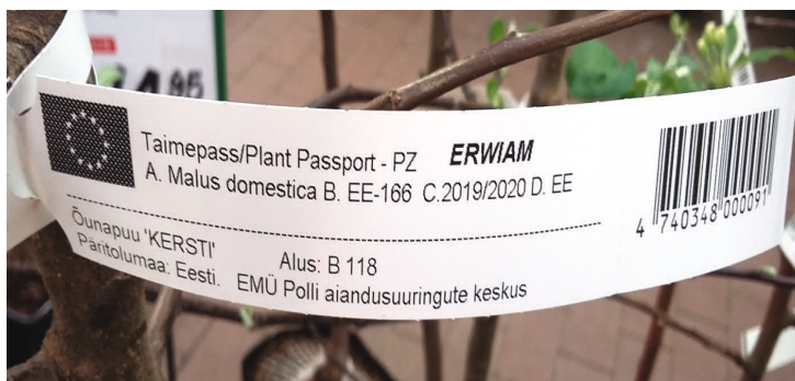
Kaitstava piirkonna taimepass

Soovitame hoida taimepassid alles! Viljapuu-bakterpõletiku kahtluse korral on see abiks kahjustaja päritolu tuvastamisel.