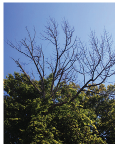
Steven Katovich, Bugwood.org

Nii saare-salehundlane kui seenhaigus saaresurm võivad põhjustada saarepuu võra kuivamist ja vesivõsude kasvu.