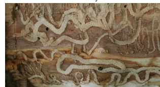
Troy Kimoto, Canadian Food Inspection Agency, Bugwood.org

Saare-salehundlase S-kujulised vastsekäigud