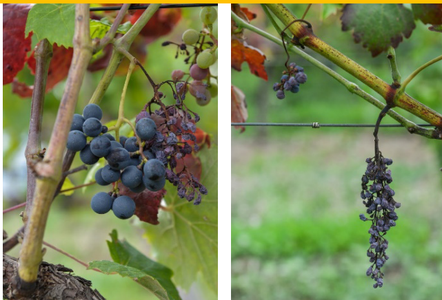
Obr. 6, 7: Příznaky choroby na hroznech