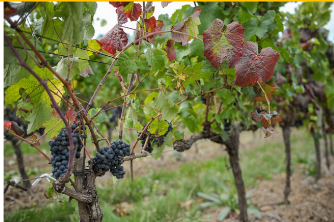
Obr. 3: Příznaky choroby ve vinohradu na listech modré odrůdy