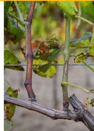
Obr. 4, 5: Příznaky choroby na letorostech